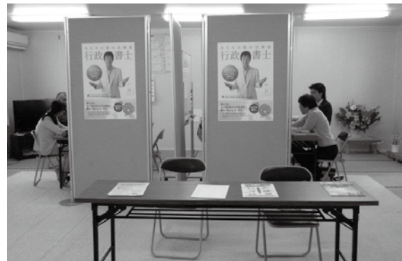
無料相談会の様子。