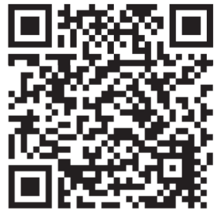
「新型コロナウイルス感染症対策」 関係情報はこちらからご覧ください。