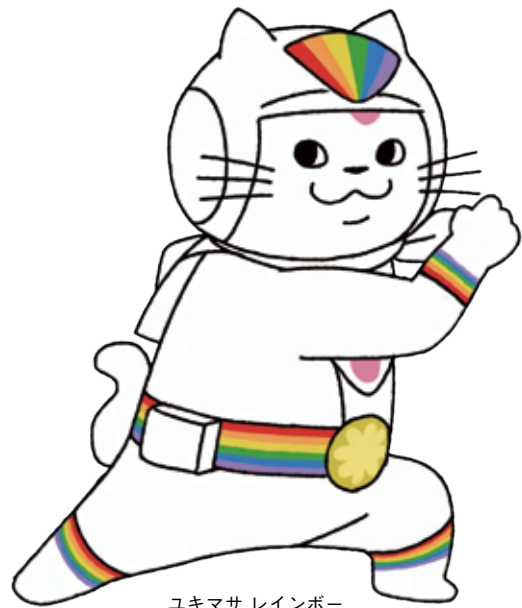
ユキマサ レインボー (LGBT等の方)