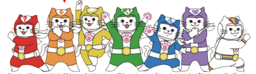
行政書士ユキマサ レッド! (高齢者) オレンジ! (子ども) イエロー! (女性) グリーン! (外国人) ブルー! (障がい者) パープル! (みんな) レインボー! (LGBT等の方)

行政書士は、書類作成及びその提出等を行うことを通じて、権利擁護のお役に立ちます。ご相談は、全国の行政書士に!!