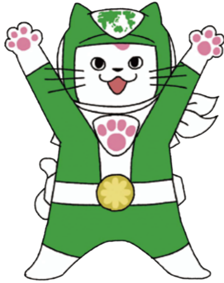
ユキマサ グリーン (外国人)