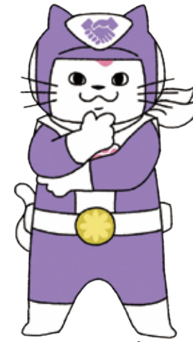
ユキマサ パープル (みんな)

行政書士は、すべての人の書類(パソコンやスマートフォンなどによるデジタルデータも含む)の作成及びその提出等の手続きを行う権利を擁護します。