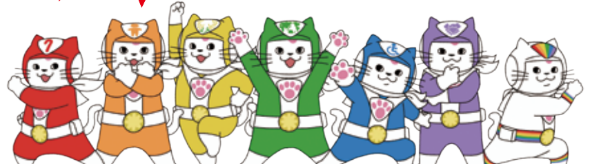
行政書士ユキマサ レッド！ オレンジ！ イエロー！ グリーン！ ブルー！ パープル！ レインボー！ (高齢者) (子ども) (女性) (外国人) (障がい者) (みんな) (LGBT等の方)

行政書士は、書類作成及びその提出等を行うことを通じて、権利擁護のお役に立ちます。 ご相談は、全国の行政書士に!!