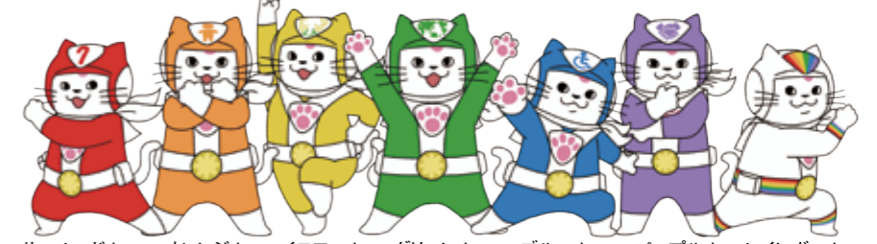
行政書士ユキマサ レッド! (高齢者) オレンジ! (子ども) イエロー! (女性) グリーン! (外国人) ブルー! (障がい者) パープル! (みんな) レインボー! (LGBT等の方)

行政書士は、書類作成及びその提出等を行うことを通じて、権利擁護のお役に立ちます。 ご相談は、全国の行政書士に!!