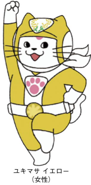
ユキマサ イエロー (女性)