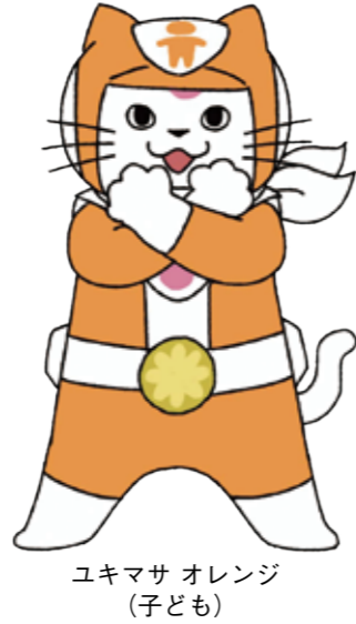
ユキマサ オレンジ (子ども)