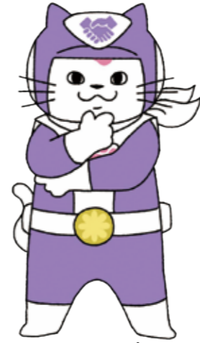
ユキマサ パープル (みんな)

行政書士は、すべての人の書類（パソコンやスマートフォンなどによるデジタルデータも含む。）の作成及びその提出等の手続きを行う権利を擁護します。