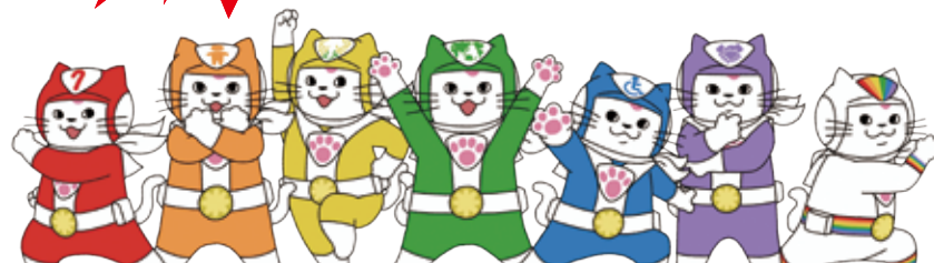
行政書士ユキマサ レッド！ オレンジ！ イエロー！ グリーン！ ブルー！ パープル！ レインボー！ (高齢者) (子ども) (女性) (外国人) (障がい者) (みんな) (LGBT等の方)

行政書士は、書類作成及びその提出等を行うことを通じて、権利擁護のお役に立ちます。 ご相談は、全国の行政書士に！！