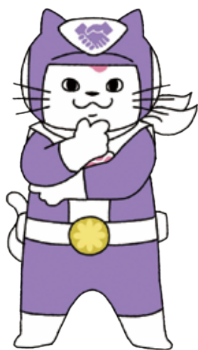
ユキマサ パープル (みんな)

行政書士は、すべての人の書類（パソコンやスマートフォンなどによるデジタルデータも含む。）の作成及びその提出等の手続きを行う権利を擁護します。