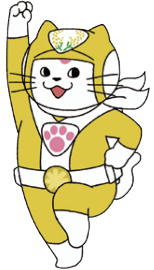
ユキマサ イエロー (女性)