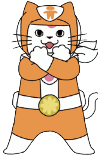
ユキマサ オレンジ (子ども)